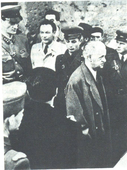
General Maléter – hier noch als Oberst – verlässt mit Staatsminister Tildy die Kilián-Kaserne

Ministerpräsident Nagy bildete seine Regierung um. Als neuen Verteidigungsminister berief er den 39jährigen Panzer-Oberst Pál Maléter in das Kabinett und beförderte ihn zum Generalmajor. Zuvor hatte Maléter mit seinen Soldaten in der Kilián-Kaserne mitten in Budapest während mehreren Tagen dem sowjetischen Ansturm widerstanden. Gemeinsam mit jungen Aufständischen aus dem benachbarten Arbeiterviertel trotzte er den sowjetischen Angriffen. Maléters Name wurde in der ganzen Stadt bekannt. Man nannte ihn «Held von Budapest» – obwohl der hochgewachsene Offizier stets betonte, er sei kein Rebell, er habe lediglich die Befehle der Regierung ausgeführt und handle nach der (damaligen) Devise der Ungarischen Volksarmee: «Mit dem Volk zusammen – wenn es sein muss, durch Feuer und Wasser!»