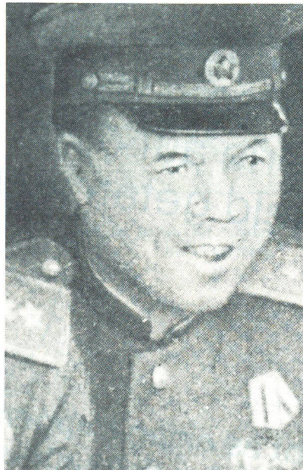
Generaloberst M. S. Malinin OB der sowjetischen Truppen in Ungarn 1956

sich, als ob nichts geschehen wäre, mit gleichmütigem Gesicht seinem Gesprächspartner zu. «Wir verlangen» sagte er langsam und betont, «dass unsere Truppen beim Grenzübertritt mit allen Ehren und mit Blumen verabschiedet werden!» (In dieser Minute betrat ein Offizier das Zimmer. Er ging zu Malinin, beugte sich vor und flüsterte ihm etwas ins Ohr. Das Gesicht des Generals blieb unbewegt. Er nickte nur kurz, warf einen Blick auf Maléter und dann wiederholte er den Satz: «...Sie müssen unsere Truppen verabschieden...!» Maléter: «Einverstanden! Aber nur die ersten und die letzten!» Malinin schien geistig abwesend zu sein. «Ja», sagte er dann «die ersten und die letzten...» Dann konzentrierte er sich wieder und setzte fort: «Ein weiterer Punkt des Vertrages ist die Wiederherstellung unserer Denkmäler. Während des Aufstandes wurden viele Heldendenkmäler der Sowjetarmee beschädigt. Die müssen in den ursprünglichen Zustand gebracht