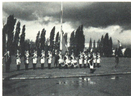
Les Vieux Grenadiers et les Piquiers 1602 de Genève hissen das Landesbanner.

Die 36. Jahrestagung der Veteranen-Vereinigung des SUOV fand am 11. Oktober 1981 in Genf statt. 1/3 der Teilnehmer leisteten der Einladung der Organisatoren Folge und reisten bereits am Samstag in die Stadt Calvins. Sie wurden in der Kaserne einquartiert und am frühen Abend ins Lokal der Genfer Sektion geführt, wo ihnen ein Ehrentrunk offeriert wurde. Ein gemeinsames Nachtessen setzte den Schlusspunkt des Abends. Am Sonntagmorgen, nachdem der Regen der Sonne gewichen war, konnte die Fahne in einem schlichten Zeremoniell unter Mitwirkung je einer Gruppe der «Vieux Grenadiers» und der «Piquiers 1602» in ihren historischen Uniformen, begleitet von einer Ehrensalve, Modell Napoleon, hochgezogen werden.