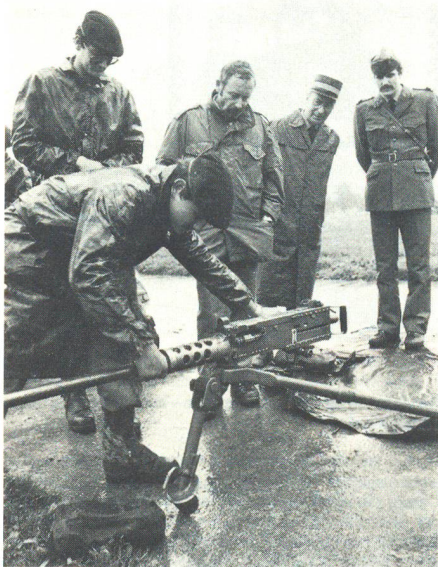
... und im Brugger Schachen, wo ein Rekrut gerade sein Können im Umgang mit dem LMG demonstriert.