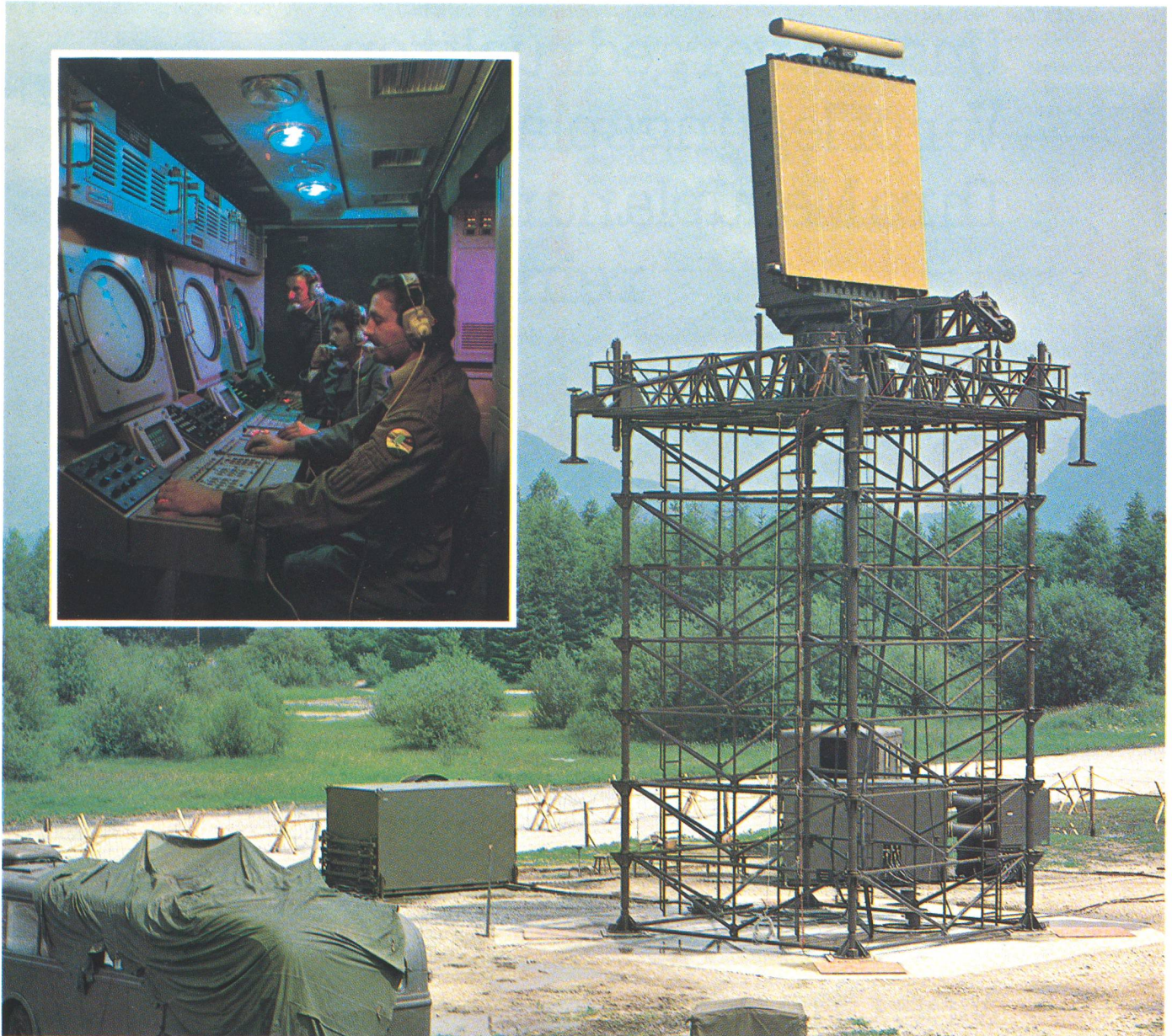
MRCS 403/RAT-31S in Stellung in Österreich