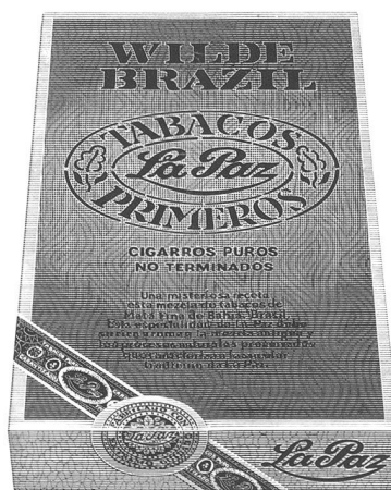
Wilde Havana und Wilde Brazil von La Paz Die oft kopierte, doch nie erreichte Wilde. Einzigartig im Aroma. Aus Tabak, mehr nicht. 5 Stück Fr. 3.—