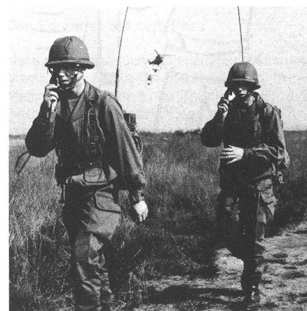
Sergent der 11. Fallschirmjägerdivision

Insgesamt gesehen, erreichen nur sehr wenige ehemalige Unteroffiziere einen höheren Dienstgrad als Oberleutnant. Je älter das Eintrittsalter in die Offizierslaufbahn ist, um so niedriger sind die Laufbahnerwartungen.