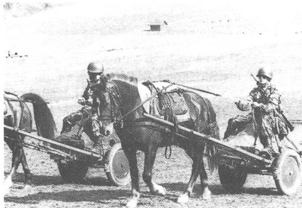
...die andere der einspännige Zug des Infanteriekarrens.