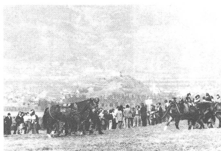
Im Vordergrund Train und Publikum, im Hintergrund das «Ländle» (Liechtenstein)

Mit dem Karren wird bereits kennehaft gefahren. Die Trainsoldaten wissen dieses Mittel bestens einzusetzen und beherrschen die Führung des Pferdes auch in weglosem Gelände.