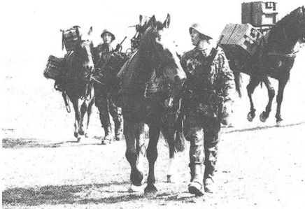
Der Train verfügt hauptsächlich über zwei Transportmöglichkeiten. Die eine ist das gebastete Tragtier...