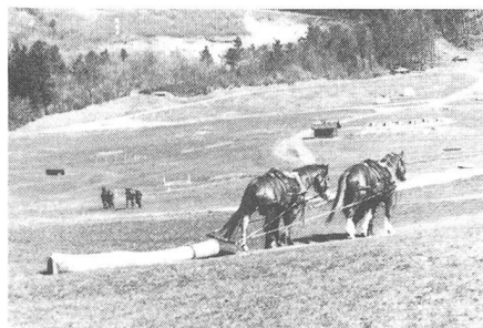
Der zweispannige Langholzzug als Beispiel für die Vielseitigkeit der Traintruppe. Die Last könnte hier natürlich militärischer Natur sein.

Erstmals fand der bereits zur Tradition gewordene Besuchstag der Train-Schule mit der neu zugewiesenen Nummer 20 statt. Den Grund für dieses numerische Avancement möge man nicht zu weit suchen, er liegt ganz einfach darin, dass eine neu geschaffene Panzerabwehrschule (PAL) die frei gewordene Nummer 18 übernommen hat.