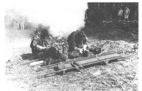
AC-Ausbildung bringt immer wieder grossen Stress in die Reihen der betroffenen Soldaten. Hier wird zur Abwechslung das Publikum eingenebelt.