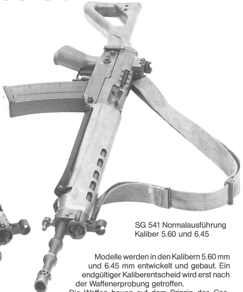
SG 541 Normalausführung Kaliber 5.60 und 6.45

Für die Verteidigung ihrer Unabhängigkeit und Souveränität braucht die Schweiz Waffen — heute und morgen. Sie braucht aber auch eine eigene, leistungsfähige Waffenindustrie wie die SIG.