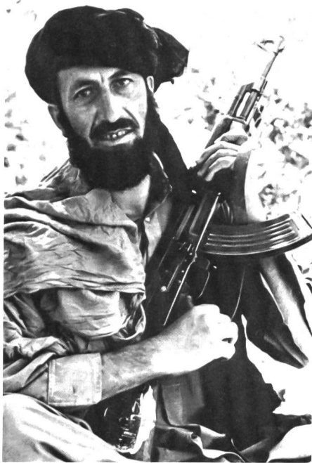
Mujahed (sprich Mudschahed). Das Bild des unbeugsamen, afghanischen Widerstandskämpfers.

Unter diesen Titeln werden die Leser des «Schweizer Soldat + FHD Zeitung» in Zukunft in regelmässigen Abständen über den vergessenen Krieg in Afghanistan und die militärische Okkupation dieses Landes durch die Sowjetunion orientiert.