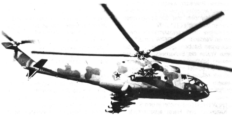
Modernste Waffen im Einsatz gegen die Widerstandskämpfer. Kampfhelikopter Mi-24 HIND, bewaffnet mit Mg/Bordkanone, Raketen, Bomben, Lenkwaffen und zusätzlicher Transportkapazität für 8–10 Soldaten.

entscheidend zu schwächen und die Grenzübergänge wirksam zu kontrollieren. So hat sich der Widerstand der Mujaheddin in den genannten Gebieten noch erheblich verstärkt, wie überhaupt ihre Ak-