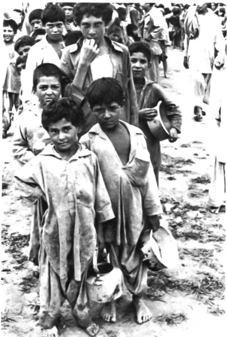
Die Flüchtlingslager: Das elende Dasein der Geflohenen heisst Krankheit, Unterernährung, Verzweiflung.

Zur aktuellen militärischen Lage in Afghanistan (1)