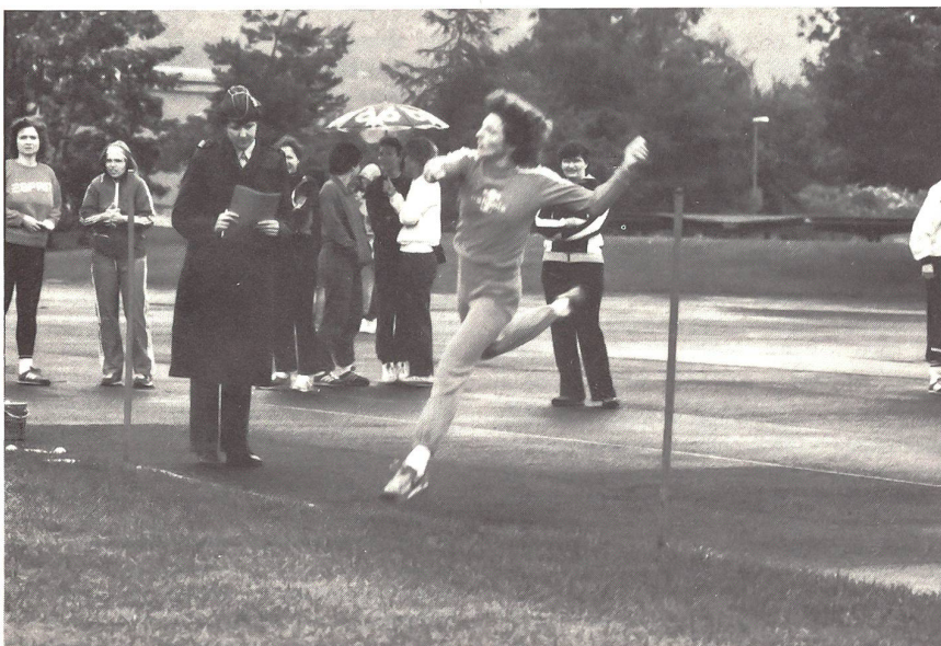
Sport im Dienst und ausserdienstlich auch für weibliche Armeeinghörige.

Die vollamtlichen Sportof auf Stufe Div und Ter Zo absolvieren als Beförderungsdienst die Zentralschule II B (27 Tage) sowie einen speziellen Ausbildungskurs für Sportof HE (20 Tage). Letzterer wird durch die Sektion ausserdienstliche Tätigkeit organisiert und durchgeführt. Jährlich findet zudem ein zweitägiger Instruktionsrapport statt, zu welchem die vollamtlichen Sportof HE sowie die Sportverantwortlichen der beiden Frauenorganisationen aufgeboden werden.