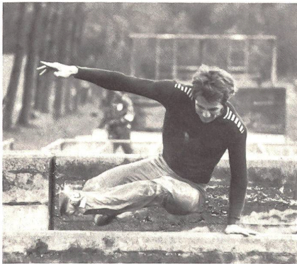
Sportliche Grundsicherung auf der Hindernisbahn.