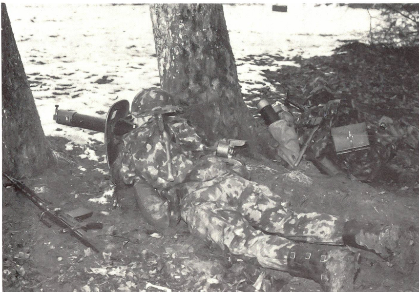
Gruppe sichert die Befehlsausgabe.