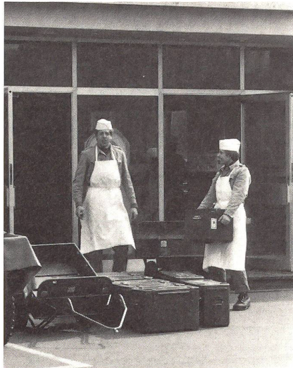
Die sichtbar gute Laune der Küchenmannschaft der III. Kompanie schlägt sich auch aufs Essen nieder. Die Kommentare der Truppe: durchwegs erstklassig.

Das Mittagessen ist für alle die willkommene Erholungspause. Natürlich ist gerade bei der kalten und nassen Winterwitterung eine reichhaltige und schmackhafte Mahlzeit für die Moral und Gesundheit von grosser Wichtigkeit. Und