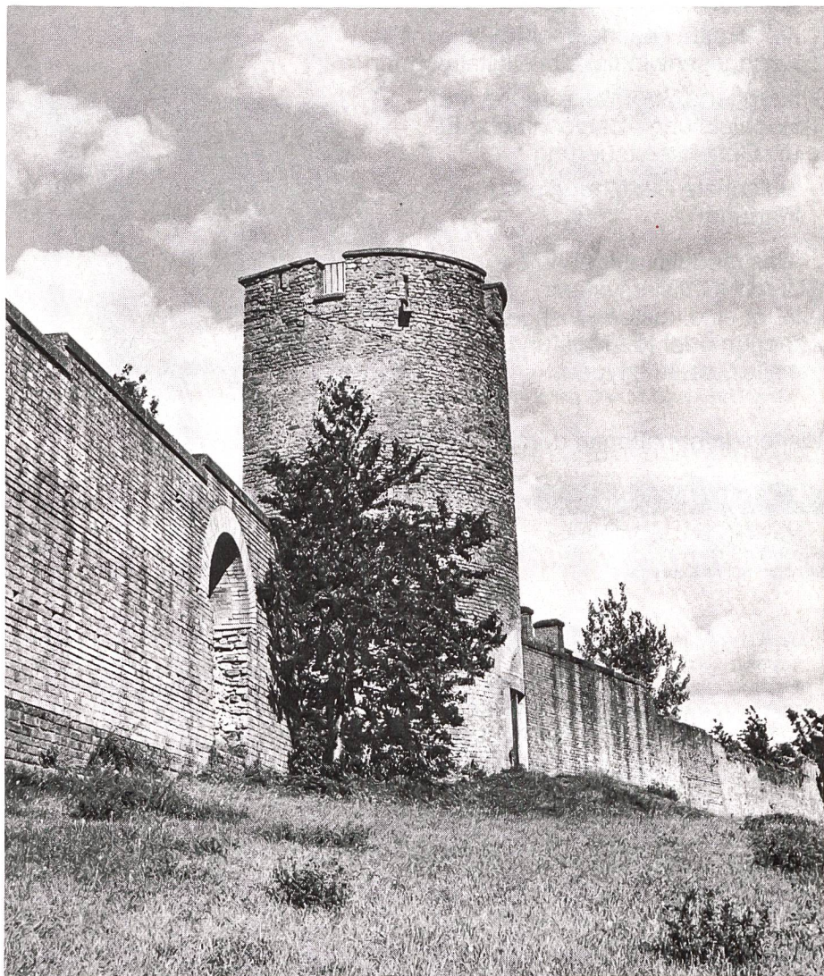
Abb 1 In der Nähe des Osttores sind ein Teil des Mauerrings und der am besten erhaltene Turm (Tornallaz) restauriert worden. Abbildung Nr 5 aus Edmond Virieux, Aventicum, Schweizer Heimatbücher 10/10a, Bern, 1961.

Nachdem sich Vitellius in Italien durchgesetzt hatte, wurde seine Herrschaft durch die Bataver am Unterrhein und durch den neuen Prätorienten Flavius Vespasianus im Osten des Reiches abermals in Frage gestellt. In Rom besetzte Vespasians Bruder Flavius Sabinus das Capitol, welches bei der Rückeroberung durch die Vitellianer in Flammen aufging. Die gallischen Druiden legten den Brand als Zeichen dafür aus, dass die Possessio rerum humanarum, die Weltherrschaft, auf die Völker diesseits der Alpen übergehe (11) – ein starker Stimulus für militärische Unternehmungen gegen Rom. Zum Krieg drängende Trevirer und Lingonen planten eine Besetzung der Alpenpässe, (12) was angesichts der römischen Besatzung von Vindonissa zu weiteren Kampfhandlungen auf helvetic