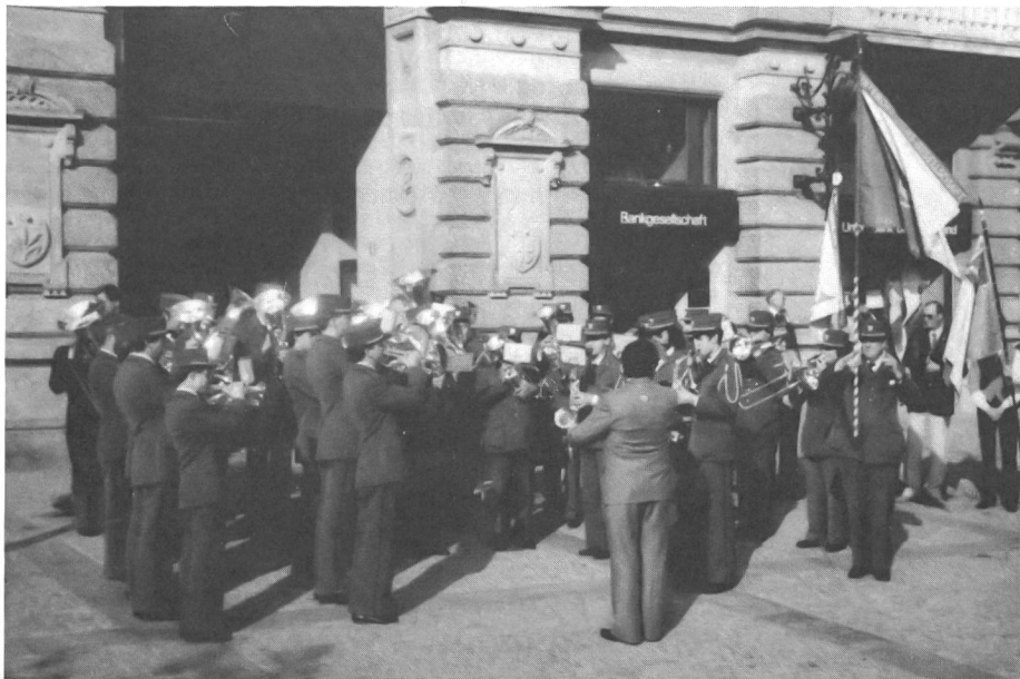
Das Schützenspiel der UOG Zürich feierte das 50jährige Bestehen.

Anmeldeschluss: 19. Oktober 1985. Die offizielle Ausschreibung samt Anmeldeatoln ist erhältlich bei SVMLT Sektion Zentralschweiz, Postfach 229, 6000 Luzern 6, Zürichstrasse.