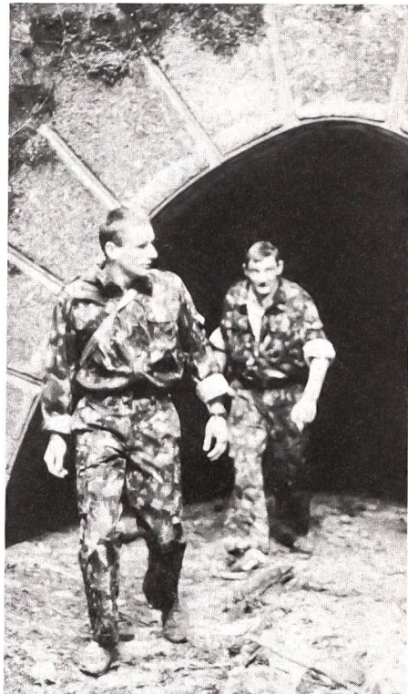
Vor der Fahnenweihe bestritten die Thurgauer UOV-Sektionen einen vielseitigen «Partisanenmarsch».

Weil die aus dem Jahre 1946 stammende Kantonal-fahne den Strapazen nicht mehr gewachsen war, beschloss der Unteroffiziersverband Thurgau an seiner letzten Delegiertenversammlung, eine neue Fahne anzuschaffen. Dank der Grosszügigkeit eines Ehrenmitgliedes und einem Staatsbeitrag gab die Finanzierung wider Erwarten wenig zu reden. Es musste nur noch eine passende und würdige Gelegenheit gefun-