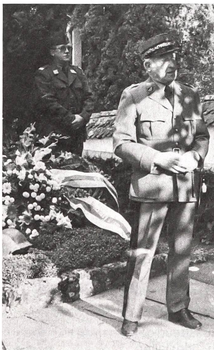
Alt Brigadier Hermann Stocker äusserte sich auf dem Friedhof Zug zur Bedeutung des Dienens im menschlichen Leben.