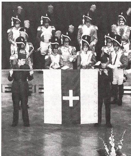
Die Beresina-Grenadiere der Harmoniemusik Zug sorgten bei der Fahnenweihe des UOV Zug für den würdigen Rahmen.

Der UOV Zug ist 100 Jahre alt und hat dieses Jubiläum im Rahmen einer Fahnenweihe im Casino Zug gefeiert. Alt Bundesrat Hans Hürlimann wollte diese festliche Zeremonie als dreifaches Bekenntnis verstanden wissen, nämlich als Bekenntnis zur Sicherheitspolitik der Schweiz, als Bekenntnis zur Miliz, aber