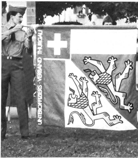
Die neue Fahne des Unteroffiziersverbandes Thurgau.