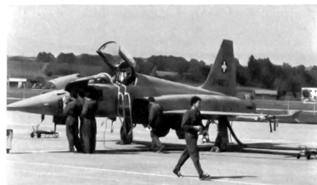
Fliegerrekruten beim Bereitstellen der Flugzeuge

Spontaner Applaus ertetete die an der Flugdemon-