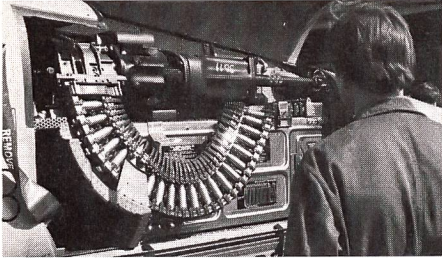
Das Aufmunitionieren gehört mit ins Pflichtenheft der Fliegerrekruten. Blick ins Innenleben einer Flugzeugnase.