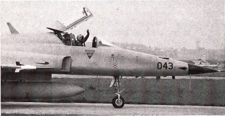
Nach der Landung. Erste Verständigung mit dem einweisenden Fliegerrekruten

stration teilnehmenden Piloten. Da war die Alouette 3, welche eine spektakuläre Rettung mittels Stahlseil vorführte. Da war aber vor allem der wohl allseits bekannte PC-7, welcher seine Wendigkeit in atemberaubenden Bildern hoch oben im Himmel oder dann knapp über den Köpfen der Zuschauer zum besten gab. Nicht minder überzeugend wirkte zudem der Pilatus Porter PC 6 B, welcher mit seinen ebenso kurzen Start- wie Landestrecken sowie dem demonstrierten Langsamvorbeiflug verblüffte. Inzwischen waren auch die Kampfflugzeuge startbereit. Unter grossem Getöse verliessen sie nach und nach die Piste und kehrten dann später wieder zurück, um von den Rekruten, den eigentlichen Hauptakteuren des Tages (welche man allerdings inzwischen beinahe vergessen hatte), eingewiesen und entsprechend abgecheckt zu werden.