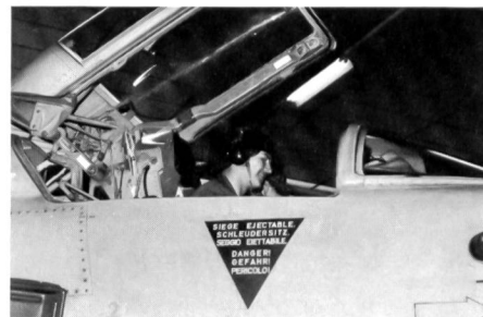
Auch das Cockpit der Kampfflugzeuge ist ein Arbeitsplatz der Fliegerrekruten.