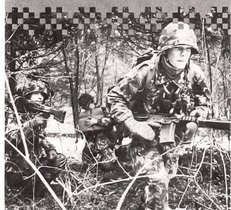
Von 1955 bis August 1968