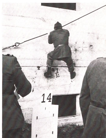
Wie schwierig sind die einzelnen Hindernisse des Hindernislaufes? Bereits am Zentralkurs in Chamblon konnten die ersten Erfahrungen gesammelt werden.