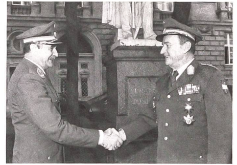
Kommandoübergabe beim österreichischen Bundesheer: rechts der Scheidende, links der neue Armeekommandant.

Zwischen den USA und der Bundesrepublik Deutschland wurden kürzlich Vereinbarungen getroffen, die einen wesentlichen Beitrag für die Stärkung der konventionellen Verteidigungsfähigkeit und der integrierten Luftverteidigung in Mitteleuropa bedeuten. Dies als hervorragendes Beispiel für eine funktionierende transatlantische Kooperation, die sich in der Vergangenheit nicht immer optimal darstellte. Die USA stellen der Bundeswehr zwölf taktische Feueinheiten des Luftabwehr-Raketensystems «Patriot» und zwei weitere Systeme für Ausbildung, Instandsetzung und Umlauf zur Verfügung. Die Bundeswehr wird 27 Feueinheiten des Flugabwehr-Raketensystems «Roland» für den Objektschutz von drei US-Basen bereitstellen, die von deutschem Luftwaffenpersonal zehn Jahre bedient und gewartet werden. Zusätzlich bedienen und warten deutsche Soldaten 12 US-Patriot-Feueinheiten des US-Heeres im südlichen Bereich der 4. taktischen Luftflotte. Die Bundesrepublik Deutschland kauft weitere 14 «Patriot» und beschafft 68 Flugabwehr-Raketensysteme «Roland», die vorgesehen sind für den Schutz deutscher Einsatzflugplätze, die auch von den USA mitbenutzt werden. Die Finanzierung sieht eine ausgewogene Verteilung des Aufwandes zwischen beiden Partnern vor. HSD