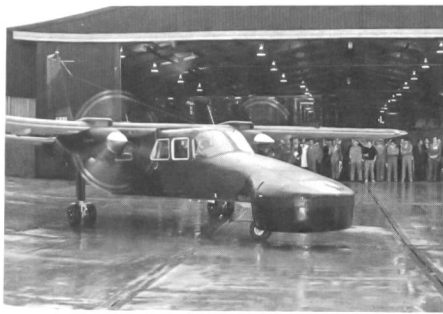
Im Laufe des Jahres 1985 will das britische Verteidigungsministerium darüber entscheiden, welches der beiden unter Wettbewerbsbedingungen entstandenen Gefechtsfeld-Überwachungsradarsysteme Castor (für

«Corps Airborne Stand-Off-Radar» für die Teilstreitkräfte Heer und Luftwaffe beschafft werden soll. Neben der Firma Thorn-EMI, deren Radar an Bord eines modifizierten Bombers Canberra mitgeführt wird, bewirbt sich auch die Radar Systems Division von Ferranti um diesen Auftrag, wobei als Einsatzträger der kostengünstige Islander von Pilotus Britten Normann Ltd. gewählt wurde. Unsere Foto zeigt die Castor-Musterinstallation mit dem einen Bereich von 360 Grad abdeckenden Mehrbetriebsartenradar im Rumpfbug. Castor dient der Allwetter-Erfassung von stationären und beweglichen Luft- und Erdzielen (zB Helikopter und Panzer) im Bereich des VRV bis in die Tiefe des gegnerischen Raumes und liefert Entscheidungsgrundlagen für den Einsatz von Aufklärungs- und Feuerleitdronen (Projekt Phoenix). Die vom Castor-Radar erfassten Daten werden im Fluge ausgewertet und automatisch an Bodenstationen zur weiteren Bearbeitung und Entschlussfassung übermittelt. ka