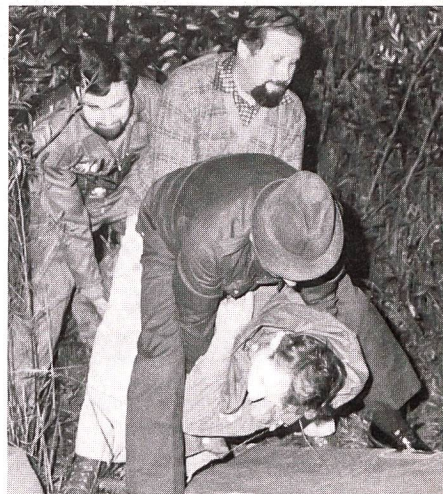
Auch das Bergen der «Verletzten» gehörte zur wirklichkeitsnahen Spreng- bzw Sanitätsübung des UOV Bischofszell.

ren die Mitarbeit bei den Schweizerischen Artillerietagen und beim Jubiläum «50 Jahre Frauenfelder Militärwettkampfmarsch und 50 Jahre Thurgauer Militärtrömpeter». Weil daneben die Mitgliederwerbung nicht ganz die gewünschten Erfolge zeigte, wird zu vermehrter Aktivität in dieser Richtung aufgerufen, besonders im Hinblick auf die SUT 85 in Chamblon/Yverdon. Daneben ist der Marschgruppenführer des UOV Frauenfeld auf der Suche nach Wehrmännern, die an einer Teilnahme am Berner Zweitagemarsch und am Viertagemarsch von Nijmegen (Holland) interessiert sind.