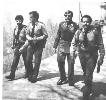
Wehrmänner am MuZ (Marsch um den Zugersee)