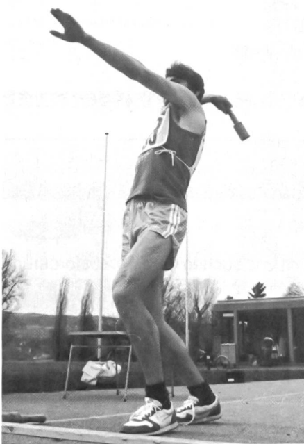
Beim Frühjahrs-Dreikampf in Steckborn musste mit dem Wurfkörper ein kleines Ziel in 20 Meter Entfernung getroffen werden.

Der UOV Bischofszell plant ein eigenes Klublokal mit Materialmagazin. Eine Holzbaracke, die kostenlos übernommen werden kann, soll in Fronarbeit aufgebaut werden und 24 Personen Platz bieten.