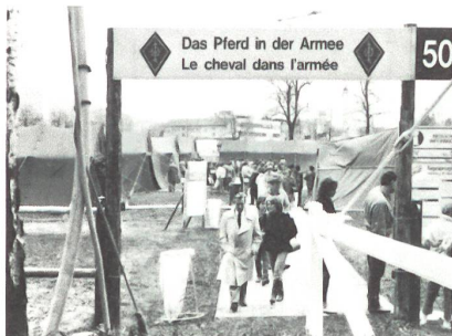
Das Pferd in der Armee fand an der BEA besonders grosse Beachtung. Das Train-Camp war denn auch entsprechend gut frequentiert.

Analog der Bernischen Ausstellung (BEA) fand auf dem Gelände der Eidgenössischen Militärpferdeanstalt (EMPFA) erstmals eine gesamtschweizerische Pferdeausstellung, die Pferd 86 statt. Anlässlich verschiedener Sonderschauen, Wettkämpfe und Vorführungen wurde dem Besucher das schweizerische Pferdewesen in seiner Vielfalt vorgestellt. So durfte auch das Pferd in der Armee nicht fehlen. Die Train RS 20 war während der gesamten Ausstellungszeit in Zugstärke mit dabei.