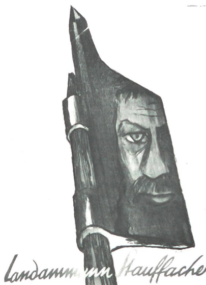
Plakat von Alois Carigiet 1941.