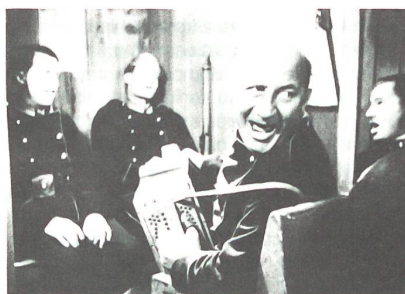
«Füsilier Wipf», ein Film, den damals jeder dritte Schweizer gesehen hat.

Für den heutigen Menschen mögen die Werbestrategien der geistigen Landesverteidigung plump erscheinen, doch überlegen wir uns, mit wie einfach konzipierten Werbefilmen heutige Hausfrauen zum Kauf eines bestimmten Waschmittels gebracht werden, so müssen wir eingestehen, dass die Propaganda der geistigen Landesverteidigung nach ähnlichen Konzepten gestrickt war, wie dies ein beträchtlicher Teil heutiger Filmwerbung ist: Identifikationsfiguren (z.B. soziologisch ermittelte «Wunschhausfrauen») haben einen Konflikt (z.B. schmutzige Wäsche) zu lösen. Der Realitätserersatz Film (z.B. Werbespot) zeigt mit affektiven Mitteln (z.B. Musik), dass die Konfliktlösung (z.B. saubere Wäsche) möglich ist, wenn die Zuschauerin mit den gleichen Mitteln (z.B. bestimmtes Waschmittel) kämpft, wie die Identifikationsfigur . Nach dem skizzierten Schema hat der Schweizer Film von 1938–1945 für die Armee geworben. Es wäre leicht, kritisch darüber herzufallen. Doch unterschätzen wir die politische Lage der Zeit nicht. Seit dem Frühjahr 1940 lag die Schweiz geographisch und geistig vollständig isoliert inmitten von Ländern, die – teils freiwillig, teils gezwungenermassen – versuchten, nationalsozialistisches Gedankengut in unser Land zu schleusen. In die Ratlosigkeit einer öffentlichen Meinung, die zwischen Resignation, Wille zu Anpassung und Widerstand schwankte, fiel die berühmte Rede des Bundespräsidenten PILET-GOLAZ vom 25. Juni 1940, die dem Schweizervolk in undeutlicher