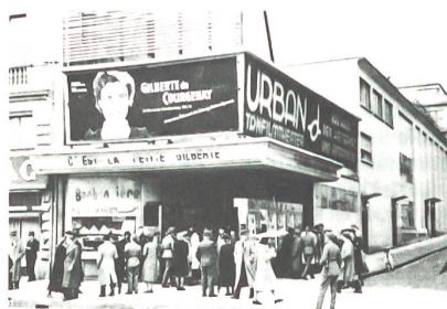
«Gilberte de Courgenay» lief 1941 bei der Uraufführung im Zürcher Kino Urban zwölf Wochen.