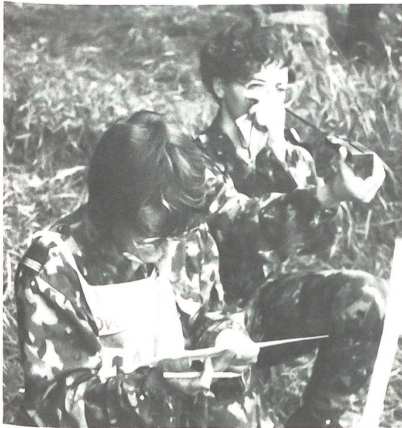
Eine Patrouille in Liestal an der Arbeit.

Von den am 13./14. Juni in Liestal durchgeführten Sommer-Wettkämpfen der A Uem Trp / FWK / Trsp Trp / FF Trp liegen in der Kategorie MFD die folgenden Resultate vor: