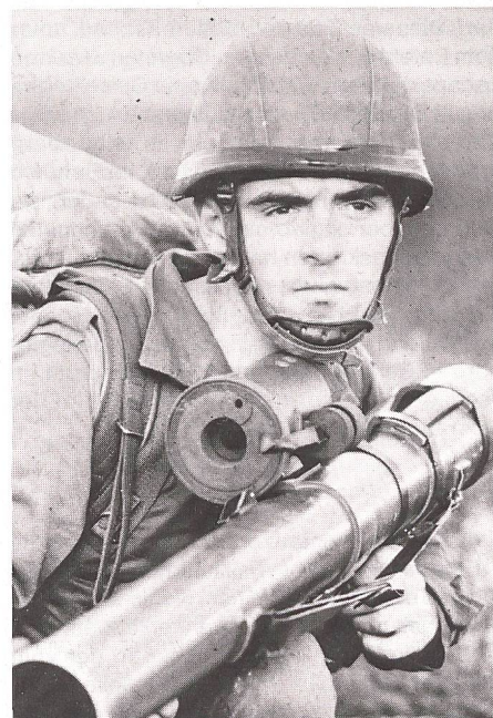
Legionär mit Panzerabwehrwaffe LRAC

Für die Schweiz brachte nicht etwa das Jahr 1815 das Ende der fremden Dienste. In diesem Jahr wurde die immerwährende Neutralität der Schweiz am Wiener Kongress völkerrechtlich anerkannt. Für die Aufhebung der Schweizer Söldnerregimenter brauchte es Zeit. 1815 wurden die 6 Soldregimenter für Frankreich aufgelöst. 1816 2 Schweizer Regimenter des Piemonts und 3 im Dienste von England stehenden Regimenter. Im Jahre 1830 fand der Solddienst von 4 Regimenter für Holland und 5 für Spanien sein Ende. Erst 1859 wurden die letzten im Solde von Neapel stehenden 4 Schweizer Regimenter aufgelöst und das Verbot der Anwerbung von Schweizern für fremde Dienste erlassen. Das war das Ende des Solddienstes von Schweizern für fremde Herren. Während 400 Jahren standen über 2 Millionen Soldaten, 70 000 Offiziere und 700 Generale der Eidgenossenschaft in fremden Diensten. Viele davon kamen zu Ehren oder /und zu Geld, andere kamen krank zurück und viele verloren ihr Leben auf den Schlachtfeldern fern der Heimat. Heute leisten noch Schweizer Dienst in der päpstlichen Schweizergarde als Schutzwache im Vatikan.