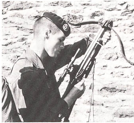
Der Einsatz mit der Armbrust wird geübt

Dann folgt für die Fallschirmspringerlegionäre des 2. Regiments eine wohlverdiente Ruhepause. Aber schon bereiten sie sich auf ihre Abreise nach Djibuti vor, wo eine Kompanie des 2. Fallschirmspringerregimentes der Legionäre turnusgemäss alle vier Monate der 13. Halb-Brigade der Fremdenlegion auf dem Stützpunkt Arta am Golf von Tadjourah Verstärkung bringt. So wurde es wahr für diese Männer: «- Sie würden fremde Länder sehen, versprach man ihnen...!».