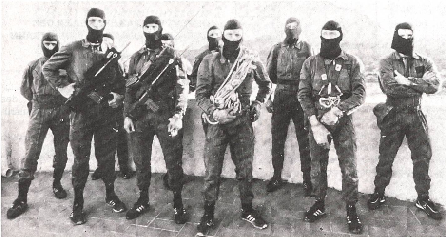
Das speziell auf einen Auftrag hin ausgerüstete Einsatzkommando für Fernaufklärung und Angriffe hinter den feindlichen Linien