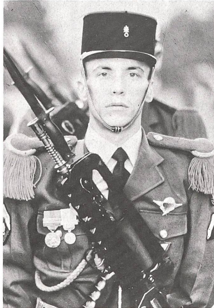
Unteroffizier des 2. Französischen Fallschirmspringerregimentes der Legion

Kaum in die Heimat zurückversetzt, wird die 1. Kompanie des 2. Fallschirmspringerregimentes der Legion zu einem Kommando Ausbildungskurs nach den Pyrenäen abbeordert. Dort oben, in 1600 Meter Höhe, in der vom berühmten Vauban erbauten Zitadelle Montlouis, sehnen sie sich zurück nach der Tropenhitze von Bouar und Bangui. Zum vierten