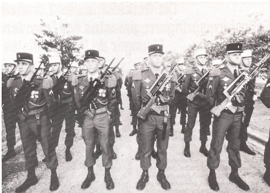
Legionäre des 2. Französischen Fallschirmspringerregimentes der Fremdenlegion

Dann kommen die grossen Manöver. Das ganze Regiment beteiligt sich am Angriff. Angriffsziele sind die Zitadelle «Saint Nicolas» von Calvi und das Lager Raffali. 20 Hubschrauber der leichten Luftwaffe der Landtruppen übernehmen den Luftransport. Als erstes gilt es, unbemerkt möglichst nahe ans Ziel heranzukommen. Dort muss eine Gruppe Infanteristen mit ihrer Panzerabwehrwaffe (LRAC) und Maschinengewehr (FM) landen und in fünf Minuten zum Feuerschutz einsatzfähig sein. Gleichzeitig springen Tauchschwimmer der 3. Kompanie mit ihrem Amphibienmaterial und Schlauchbooten von «Pumas» ab und versuchen eine Landung. In der Nacht springen die Soldaten der ersten Riegelstellungen und die Kampfhandlung kann fortgesetzt werden. Aber um Vordringen