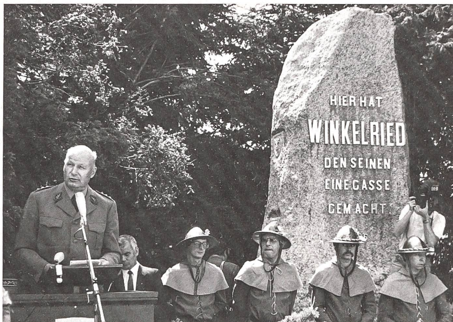
601. Gedenkfeier der Schlacht bei Sempach

● Eine weitere, grundlegende Grundbedingung der Moral liegt in der festen Überzeugung beider Teile, dass die geistigen und materiellen Güter, die es zu erhalten gilt, einen hohen Einsatz lohnen und dass die Güte unserer eigenen Sache einen entschlossenen Abwehrkampf wert ist. Hier fällt unsere ganze Umwelt in die Waagschale: unser Heimatland mit seinen Schönheiten, unser demokratischer Sozialstaat, unsere Kirchen, unser persönlicher Lebensraum, unsere Familien und schliesslich auch unser eigener Besitztum. Wo diese Werte nicht anerkannt sind und nicht gewürdigt werden und wo das Bewusstsein, mit ihrer Erhaltung schützenswerte Lebensbedingungen sicherzustellen , nicht vorhanden ist, kann sich eine tragfähige Abwehrmoral nicht bilden. In der Bewahrung aller dieser Werte liegt ein bedeutender Teil unserer Moralpflege. – Das Wort Bert Brechts «zuerst kommt das Fressen, dann die Moral» mag für das Dreigroschenvolk richtig sein, für den Soldaten gilt es jedoch nicht.