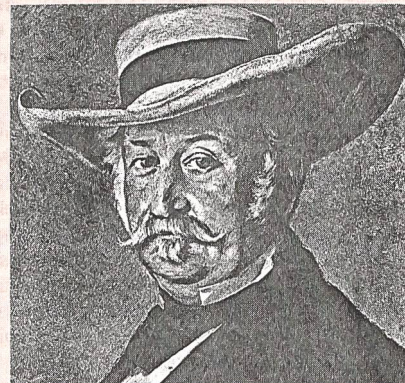
General John A Sutter, nach einem Gemälde des berühmten Schweizer Malers Frank Buchser. Das Bild ist im Kunstmuseum Solothurn.