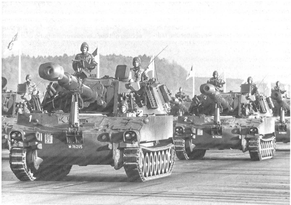
Panzerhaubitzen der Schweizer Armee des Typs M-109, Kaliber 15,5 mm, defilieren im November 1986 hier auf dem Militärflugplatz Dübendorf ZH anlässlich des ersten rein mechanisierten Truppenvorbeimarsches der Schweiz.

Glaubwürdige Abwehrbereitschaft dokumentieren, ist nicht nur eine Frage des grundsätzlichen Einstehens für die Armee und deren Alimentierung mit den notwendigen Mitteln. Dissuasion kann man nicht spielen, sie muss Ausdruck einer allgemeinen Haltung sein, die auf der inneren Überzeugung beruht, unser Land, unsere Familien, unsere Institutionen, unsere Freiheit und Unabhängigkeit zu bewahren und – wie auch immer – zu verteidigen. Mit dieser Geisteshaltung sind Kritik und Anregungen dissuasiv, da sie wertvolle Im-