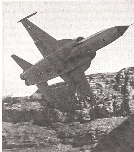
Ein «Tiger»-Kampfflugzeug im Einsatz in den Alpen. Damit die schweizerische Flugwaffe ihren Auftrag im Neutralitätsschutz und Verteidigungsfall erfüllen kann, müssen in den neunziger Jahren neue moderne Kampfflugzeuge beschafft werden.

Nach Einmann-Flab-Lenk Waffen rief bisher vor allem die Infanterie, die sich nicht ohne Grund der sehr ernst zu nehmenden Bedrohung durch Kampf-Helikopter ziemlich wehrlos ausgeliefert fühlt. Bei diesen Anforderungen gibt es ein Minimum, das nicht unter-