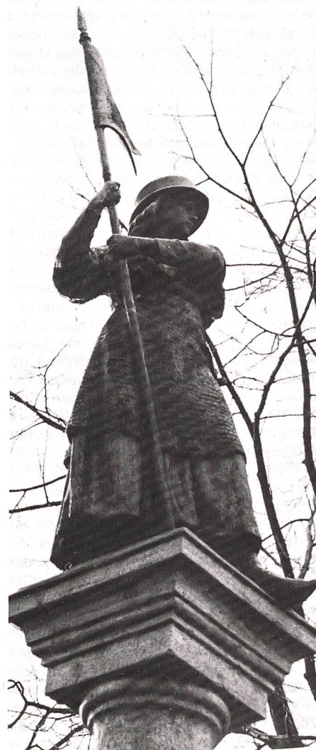
Die bewehrte Zürcherin auf dem Lindenhof erinnert an die Rettung der Stadt durch die entschlossenen Bürgerinnen im Jahre 1292.