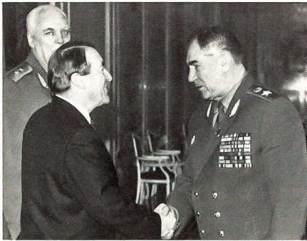
Der österreichische Verteidigungsminister Dr Robert Lichal und der sowjetische Verteidigungsminister Armeegeneral Dimitrij Jasow (rechts).

MiG-29 in einer Flugdemonstration sowie Lenkwaffen zur Panzer- und Fliegerabwehr im scharfen Schuss vorgeführt. Das besondere Interesse der Österreicher fand die Ein-Mann-Fliegerabwehrwaffe «Iglu M-1».