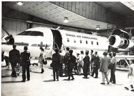
Mitglieder des UOV Untersee-Rhein besichtigen einen REGA-Ambulanzjet.

Die Mitglieder dieser Sektion hatten zusammen mit dem Thurgauer Feldweibelverband Gelegenheit, die REGA-Ambulanzjets in Klotten zu besichtigen und sich vom Chefpiloten der REGA-Flächenflugzeuge über die Aktivitäten der Schweizerischen Rettungsflygwacht informieren zu lassen. HEE