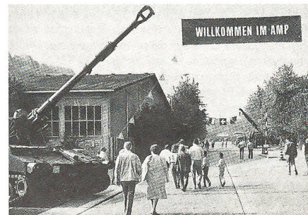
Eingang zum Armeemotorfahrzeugpark Burgdorf

Mit einem offiziellen Festakt und einem Tag der offenen Türe feierten der AMP und das Eidg Zeughaus Burgdorf Ende Juni den 25. und 70. Geburtstag. Das Jubiläum bot Gelegenheit, den Armeemotorfahrzeugpark und das Zeughaus Burgdorf der Öffentlichkeit vorzustellen. Vor allem der Tag der offenen Türe vermittelte einen Einblick in die vielfältigen, in-