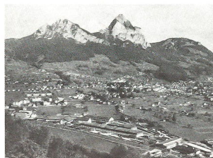
Die Zeughausanlage in der unteren Bildhälfte. Im Hintergrund der Hauptort Schwyz.

Im kriegsbedingten Schnellzugtempo wurde 1939 ein dem Zeughaus Seewen unterstelltes Nachschubzeughaus in Steinen gebaut; das erforderliche Land hatte das EMD vorsorglich schon im Jahre 1918 gekauft. Während des Zweiten Weltkrieges wurden die kriegsbedingten Aufgaben von bis zu 560 Mitarbeitern erledigt, darunter etwa 250 Hilfsdienst-Pflichtigen. Unter ihnen befanden sich viele Sattler und Schuhmacher sowie vor allem auch Schneider, war der Zeughausbetrieb von Seewen doch für die Bekleidung der ganzen Armee verantwortlich. Die während des Aktivdienstes erfüllten Funktionen blieben in der Folge dem Zeughausbetrieb in Seewen weitgehend erhalten. Zudem wurden diesem Unternehmen neu auch der umfangreiche Nach- und Rückschub von neuen Artikeln der persönlichen Ausrüstung übertragen.