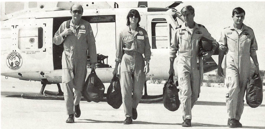
Eine zivile Beobachterequipe der MFO vor ihrem Einsatz.