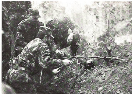
...wurde ein «Koreaofen» gebaut und benützt.

Wer sich für den Dienst als Jagdpionier interessiert, soll sich beim Kp Kdt melden. Der Anwärter hat einen zweitägigen Eignungstest zu bestehen. Die Ausbildung erfolgt während der ordentlichen Dienstleistung.