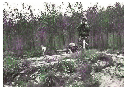
An der Kaderübung des Solothurner Kantonalverbandes konnte festgestellt werden, dass die Treffsicherheit mit dem Gewehr ...

LL. Am Samstag, 31. Oktober, fand die kantonale Kaderübung des Verbandes Solothurnischer Unteroffiziersvereine im Raume Deitingen statt. 52 Teilnehmer aller Altersklassen und militärischen Einteilungen wurden um 8.30 Uhr dem Übungsleiter gemeldet. Auf verschiedenen Arbeitsplätzen wurden in Gruppen sowohl taktische wie technische Probleme gelöst. Geschult wurden einerseits die Waffenhandhabung und deren Einsatz im Gefecht sowie die Befehlsgebung andererseits. Die Treffsicherheit unserer Unteroffiziere mit den persönlichen Waffen und dem Rak Rohr zeigen gute Resultate, hingegen verfehlen viele Handgranaten das anvisierte Ziel.