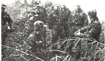
An Jagdkampf-Übung der UOV-Sektionen Zofingen und Suhrenthal...

Im ersten Übungsteil mussten die Uof ein Biwak erstellen, das auf 5 Meter Distanz nicht zu erkennen war. Die Verpflegung musste im selbstgebaute «Koreaofen» ohne starke Rauchentwicklung hergestellt werden. Dass man darin ein Brot backen kann, wurde durch den erbrachten Tatbeweis gezeigt.