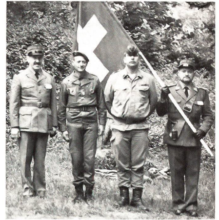
Die Schweizer grüssen

Die 30. Internationale Militärwallfahrt nach Lourdes findet dieses Jahr vom 26. bis 31. Mai 1988 statt. Information und Anmeldungen können bis zum 1. April 1988 erfolgen an: Qm Hptm Pio Cortella, Postfach 725, 6830 Chiasso (Tf Nr 091 44 39 51).