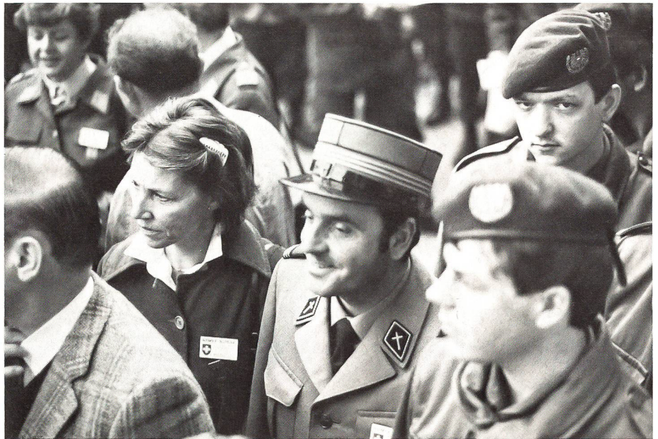
Verschieden und doch gemeinsam

Der von Jesus Christus durchschrittene Raum wurde zum «Heiligen Land» ; diese einzigartige Würde erhielt Palästina durch die Mensch-