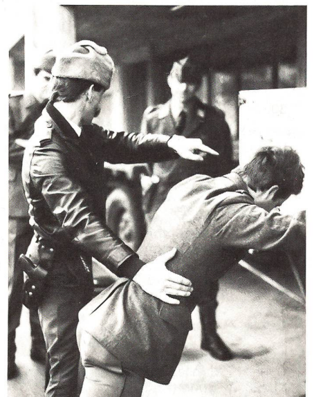
Als wichtige Helfer dienen Angehörige der Kantons-polizei.