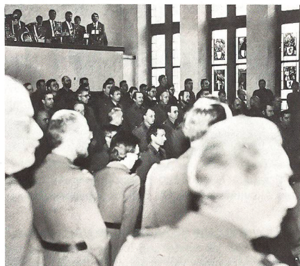
180 Offiziere des MED versammelten sich im Grossratssaal des Rathauses Bern

Sicherheitspolitik und Konfliktanalyse an der ETH Zürich, auf die gegenwärtigen Bemühungen der beiden Supermächte USA und Sowjetunion zum Abschluss des IMF-Abkommens ein. Ausgehend von den geschichtlichen Fakten, dass das Sicherheitsverständnis der Sowjetunion bisher auf der Ausdehnung ihrer Macht beruht habe, schätzte er eine drastische Abkehr von diesem Kurs unter dem Regime von Gorbatschow als eher unwahrscheinlich ein, da die beharrenden Kräfte in der Sowjetunion gross seien. Ein Kompromiss dürfte als realistischer angenommen werden. Auf der andern Seite stehe nach dem Streichen der Mittelstreckenraketen Europa geschwächt da, weil auf konventionellem Gebiet ein Ungleichgewicht der Kräfte zwischen NATO und WAPA vorhanden sei. Für die Schweiz zeige sich deshalb auch nach dem Abschluss eines IMF-Abkommens keine Morgenröte, das auf der reinen Disuasione beruhende Sicherheitskonzept kurzfristig zu ändern. Wohl könne jedoch unser Land den Beitrag zu einer Friedenspolitik in Europa noch verstärken.