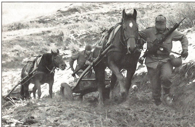
Solange als möglich mit Karren (dreifache Transportkapazität pro Pferd).

Kompromisslose Auswahl der Kader aller Stufen. Ausschlaggebende Kriterien, gleich zu werten wie die allgemeinen Führereigenschaften, sind die beispielhaft geprägte Affinität zum Pferd und die hervorragende Beherrschung des Umgangs mit dem Pferd in all seinen Formen. Wer hier Konzessionen macht, liefert die Trainruppe einem Zustand aus, den leider bis heute noch allzu viele Einheiten fristen: dem der Mittelmässigkeit. Nur ein Weg führt zum Ziel: Die unteren, mittleren und höheren Kader müssen – es darf hier keine Ausnahmen mehr geben! – « in allen Sätteln zu Hause » sein und der Truppe die Einheit von Mensch und Pferd vorleben. Dies ist möglich unter zwei Voraussetzungen, nämlich: • Dass sich der Lehrkörper der Offiziers-, Unteroffiziers-, Rekruten- und Zentralschulen aus Instruktoren zusammensetzt, die nicht nur vollwertige Militärs und menschliche Vorbilder, sondern auch, in Theorie und Praxis, durchgebildete und beispielhafte – wir brauchen diesen Begriff ohne falsche Scham – Pferdemenchen sind.