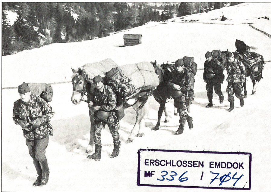
Saumkolonne, Kader zu Fuss.

Sache der Truppe ist es, sich im Sinne des Kampfauftrages auf den Ernstfall vorzubereiten. Dessen Umfang, Ort und Zeit sind allerdings vorderhand nur als Hypothesen bekannt. Die Truppenteile werden geschult im Hinblick auf wahrscheinliche und mögliche Varianten des Kampfauftrags. Das heisst, auf den Train bezogen: Pferd und Mann sollen, nach umfassender Ausbildung, allmählich bis an die Grenzen ihrer Leistungsfähigkeit geführt und von Zeit zu Zeit auf die Probe gestellt werden. Der Train muss der Truppe dienen, wenn sie ihn braucht und wo sie ihn braucht. Der gute Truppenkommandant wird sich in dessen den Einsatz von Pferd und Mann vor-