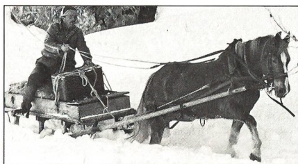
Die Auswahl der Kader, besonders der Trainoffiziere, muss strengen Kriterien genügen.

Die Bilder des Artikels über unsere Traintruppe stammen von Kpl Fritz Heinze, Herisau, Pferdefotograf und langjähriger Mitarbeiter vom Schweizer Soldat. HO