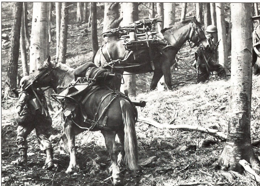
Mit der Kampftruppe bis in den Stellungsraum.