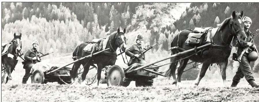
Karrenpferde am Führzügel. Es braucht wenige Minuten, um aufzusitzen und sie am Leitseil traben zu lassen oder sie in Saumtiere zu verwandeln.