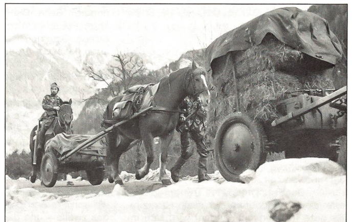
Karrenkolonne, Kader beritten.