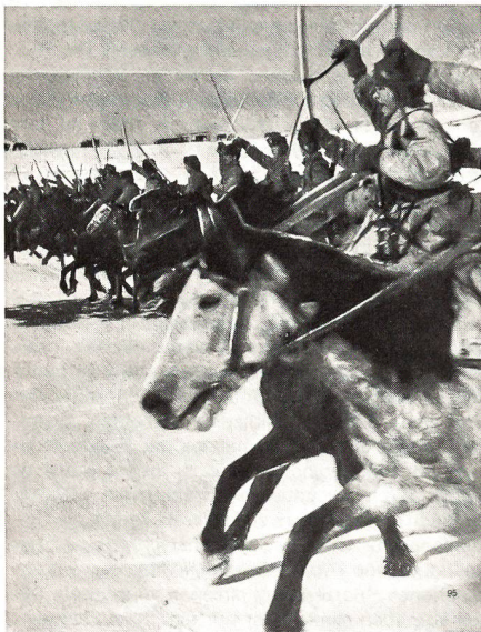
«Säbel zum Gefecht!» – «Schwadron, im Trab marsch!» So der Befehl bei einer Übung mit der Reiter-Schwadron «irgendwo» im sowjetischen Pamir-Gebirge.