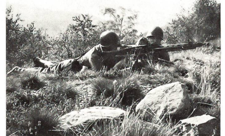
Um die Übungsvorgabe zu erfüllen, muss schliesslich die Garbe auch im Ziel landen.