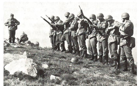
Es schadet auch nichts, wieder einmal eine stilrene Entladekontrolle nach RS-Manier durchzuführen.