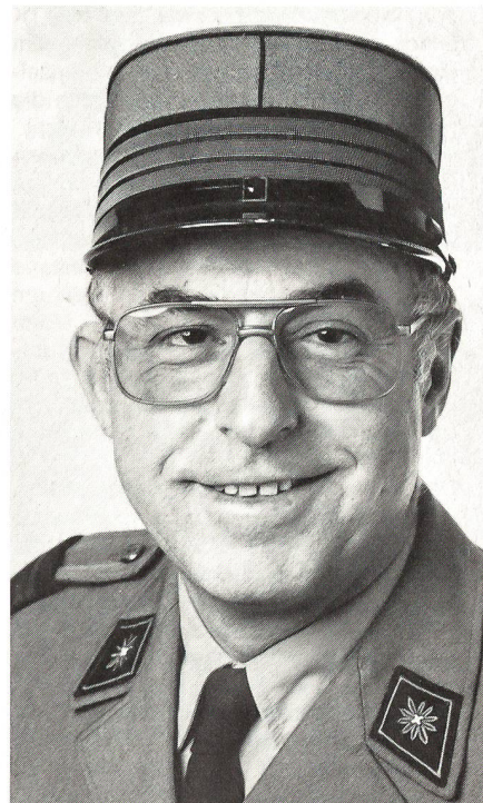
Der Kommandant des Technischen Kurses, Oberst i Gst Giuliano Crivelli.

Nach dem eintägigen KVK mit den Klassen- und Gruppenchefs rückten am zweiten Tag die 75 Offiziere ein. Bereits am Nachmittag des Einrückungstages standen diese voll ausgerüstet auf den Höhen von Gola di Lago, wo sie ihre ersten Übungen im scharfen Schuss durchspielten. In den Abendstunden erfolgte eine kurze theoretische Ausbildung im AC-Schutzdienst und im Sanitätsdienst, damit diese beiden wichtigen Gebiete bereits am zweiten Kurstag in die Gefechtsübungen