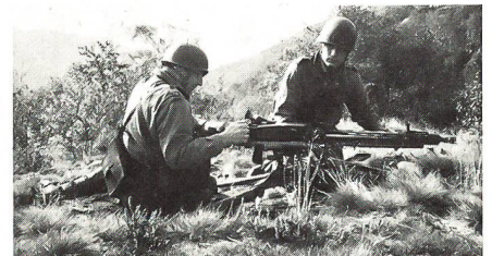
Für einmal üben die Offiziere wiederum selbst am Maschinengewehr und schlüpfen dabei in die Rolle des Mitrailleurs.

Die Organisation des Technischen Kurses brachte – so weiss Oberst i Gst Crivelli aus seinen Erfahrungen zu berichten – grosse Probleme mit sich. Dies fange schon beim Hilfspersonal an, welches eben auch aus Landwehrleuten bestehe, wo die Dienstage ohnehin gezählt seien. Trotzdem müssten diese Leute für eine Woche aufgeboten werden, denn der Kurs führe einen eigenen Küchenbetrieb, benötige Wacht- und Büropersonal sowie Leute, die Transporte ausführen können. Wie gewohnt – so Oberst i Gst Crivelli – sei halt eben auch für die Organisation dieses Kurses viel freiwilliger Einsatz nötig gewesen und auch geleistet worden. Positiv auf den Kurs ausgewirkt habe sich auch die Mitarbeit zweier Instruktionsoffiziere (Generalstabsoffiziere) aus dem Brigadestab, welche mit ihrer Erfahrung viel zum guten Gelingen des Technischen Kurses beigetragen hätten, bestätigt der Kurskommandant.