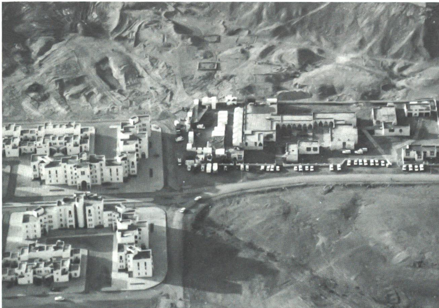
Die Klinik Laâyoune mit dem HQ «MINURSO» aus der Vogelschau