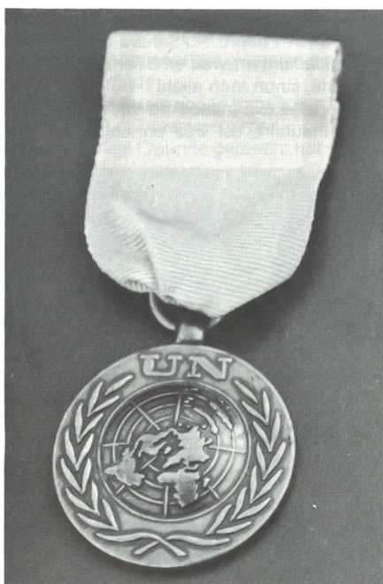
UNO-Verdienstmedaille nach 90tägigem Einsatz in der Sahara

Mit dieser militärischen Aktion können wir einer These von Div Gustav Däniker zum künftigen Gebrauch von Streitkräften entsprechen: «Militärisches Denken und Handeln in rein militärischen Kategorien darf es künftig nicht mehr geben. Selbst in Einzelheiten muss es dem Hauptziel einer umfassenden und dauerhaften (nationalen und internationalen) Existenzsicherung gerecht werden.»