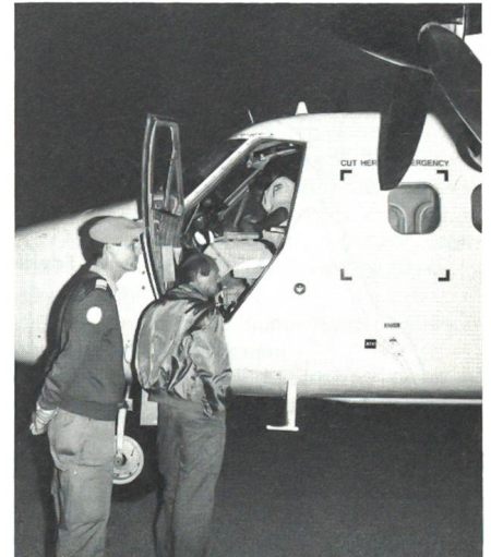
Notfall-Einsatzübung mitten in der Wüste. Gefordert ist die ständige Bereitschaft der Crew und der Flugzeuge