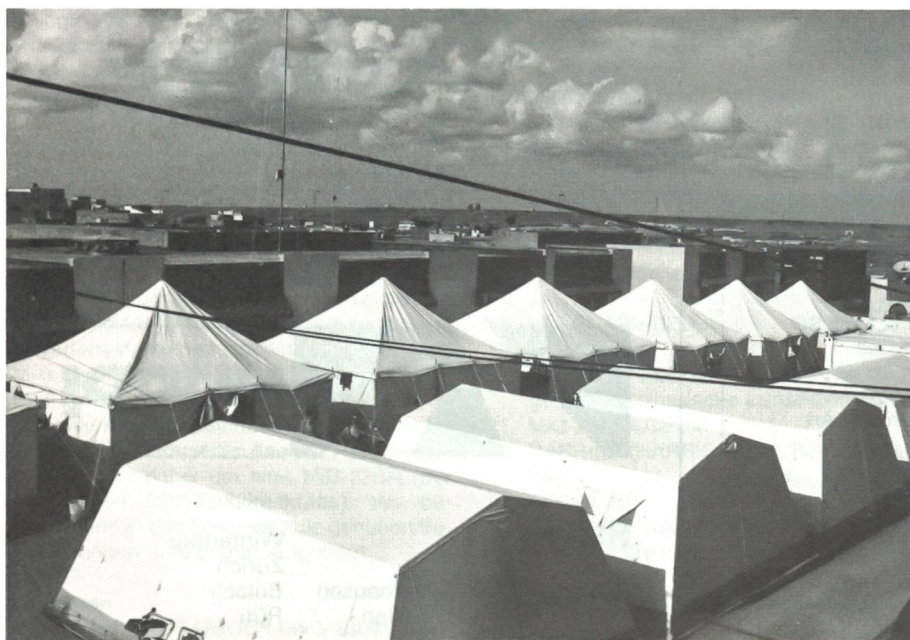
Die Zelte der Swiss Medical Unit in Laâyoune.