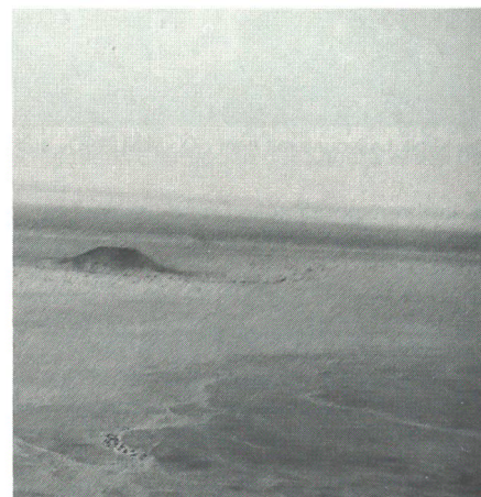
Die Weite der Wüste Sahara, Einsatzgebiet der SMU

Unsere Unit hat 3 Kliniken gebaut und den Sanitätsdienst mitten in der Wüste gewährleistet. Diese edle Aufgabe im Rahmen einer friedenserhaltenden Aktion machte alle Teilnehmer glücklich und mit vielen Erfahrungen reicher. Wir sind überzeugt, dass trotz vielen Entbehrungen «das Wassertragen in die Wüste» sinnvoll ist.