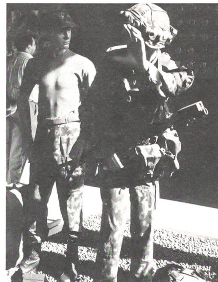
An der Ausstellung wurden auch neueste Ausrüstungen gezeigt.

Der Ursprung des heutigen Zeughauses geht auf das Jahr 1848 zurück. Seit der Renovation 1986/87 zählt