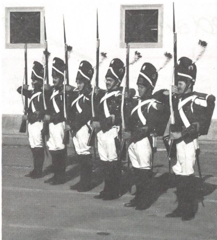
Auftritt der «Beresina-Grenadiere». Heute sind auch Frauen in dieser historischen Glarner Truppe.

Anlässlich einer Eröffnungsfeier war zu vernehmen, dass die Armee mit rund 260 000 militärischen Über-