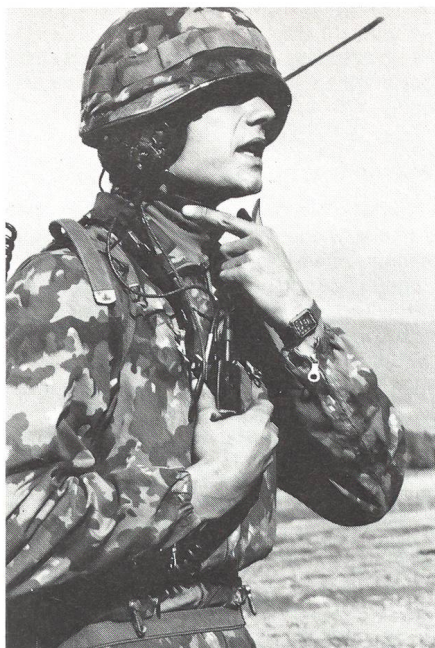
Die Fähigkeit, gestellte Aufgaben unter extremen Bedingungen lösen zu können (Kriegstüchtigkeit, Katastrophentauglichkeit) muss auch nach 1995 oberstes Ziel der militärischen Ausbildung sein. (Bild: Zugstruppunteroffizier der mechanisierten Artillerie beim Einrichten der Batterie).

An erster Stelle zu nennen wäre die Verbesserung der Führung und der Einsatzbedingungen der InstruktorInnen; als Leitsatz muss gelten, dass der Instruktor zwar Berufs-Soldat ist, der Aspekt Beruf aber mindestens ebenso wichtig ist wie der Aspekt Soldat. Die Zeiten, in denen ein Instruktor sein ganzes Leben auf dem Feld, dem Kasernenhof und im Kasino zugebracht hat, gehören längst der Vergangenheit an. Allzuoft sind das aber die Vorstellungsmuster, nach denen InstruktorInnen geführt werden. Das Übel der sogenannten Ausbildung von Lehrlingen durch Lehrlinge löst man am allerwenigsten mit einer Entmündigung des Milizoffiziers und indem man die langweiligen Phasen der Grundausbildung einfach an die