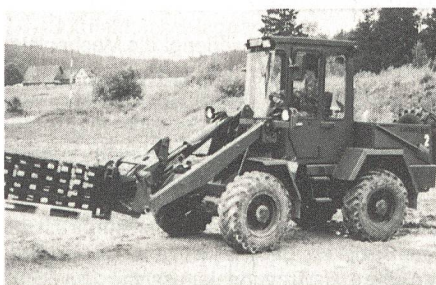
Feldumschlaggerät für die Pz Art Abt, Pz- und Mech Bat sowie für die Sch Mw Kp.

Mit der beantragten Beschaffung von 300 Feldumschlaggeräten soll allen Pz Art Abt, Pz und Mech Bat sowie allen Sch Mw Kp der Inf ein Güterumschlagmittel gebracht werden. Diesen Truppen fehlten bisher am Einsatzort weitgehend geländegängige Geräte für den Auf- und Ablad palettierter und schwerer Gü-