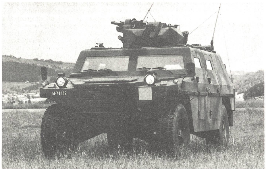
Leichtgepanzertes «Mowag»-Aufklärungsfahrzeug. Höchstgeschwindigkeit 105 km/h, Dieselmotortyp 6,2 Liter, 150 PS.

Die männlichen AdA sollen mit der neuen Ausgangsbekleidung 95 ausgerüstet werden. Mit dem vorliegenden Beschaffungsantrag