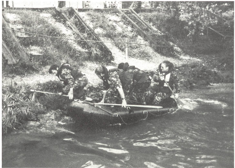
Fast am Ziel des Übersetzens

von der besten Seite. Ein harter Brocken war dann noch der Skore-Orientierungslauf. Hier galt es je nach Kategorie in 45,50 oder 55 Minuten maximal 30 Posten anzulaufen. Eine Disziplin, die doch bei einigen Patrouillen nicht so gut gelang.