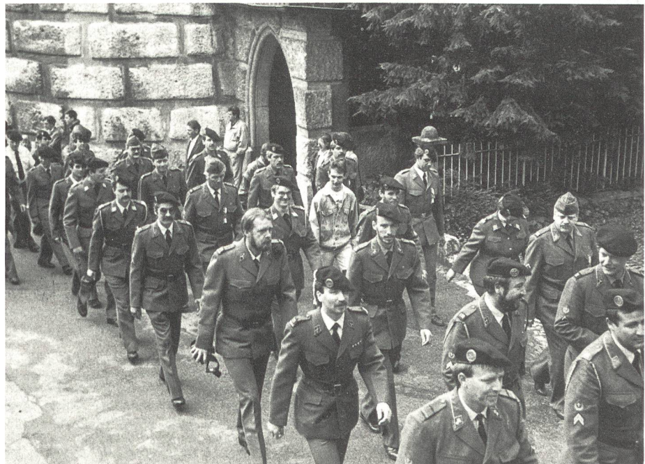
Aufmarsch zum Rangverlesen in Solothurn

Die Junioren absolvierten gleichzeitig ihre 15. Schweizer Meisterschaft. Den Junioren wird jedes Jahr anlässlich der Schweizerischen Juniorenwettkämpfe die Möglichkeit geboten, sich im Mehrkampf zu messen. Mit grosser Genugtuung konnte in Wangen an der Aare festgestellt werden, mit welchem Ehrgeiz eine Juniorin und 64 Junioren an die ihnen gestellten Aufgaben herangingen. Sie hatten zuerst das Schiessen 300 Meter zu absolvieren. Hier galt es ein Programm von 25 Schuss zu erfüllen. Bei einem Maximum von 180 Trefferpunkten erreichte der beste Schütze der Junioren doch deren 177. Beim Schwimmen galt es dann zum erstenmal die körperliche Kondition unter Beweis zu stellen. Auf dem Programm standen 100 Meter Freistil. Hier wurde eine Bestzeit von 66 Sekunden erschwommen. Als dritte Disziplin stand dann der 280 Meter lange Hindernislauf an. Unter lauten Anfeuerungsrufen zeigte an diesem Posten jeder Teilnehmer eine grossartige Leistung, wobei der schnellste die neun Hindernisse in 85 Sekunden überwand. Beim Posten Werfen galt