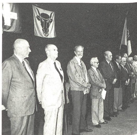
Die neuen Ehrenveteranen. Im Vordergrund alt Ständerat Franz Muheim

In seinem Bericht hielt der Zentralobmann kurz Rückschau auf vergangene Geschäfte der Vereinigung. Aus Anlass des 100jährigen Bestehens des UOV Baden wurde die nächste Tagung auf den 11. Juni 1994 in Baden festgelegt. Zum Mitgliederbestand wusste Jules Faure zu berichten, dass gegenüber dem Vorjahr eine Erhöhung um 257 Mitglieder auf neu 5233 stattfand.