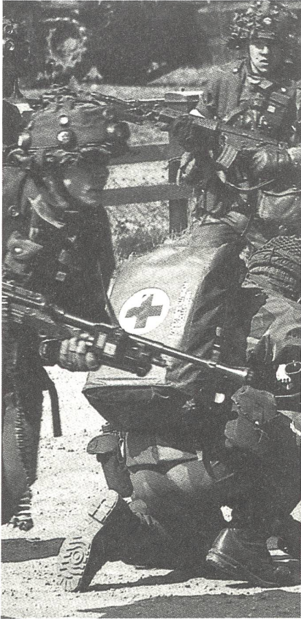
Auch die Schwedische Armee fördert die gefechtsmässige Ausbildung realistisch mit Simulatoren. Beachte die Detektoren auf dem Helm des Kämpfers links. Siehe auch Beschaffung der Schweizer Armee im Rüstungsprogramm 93 in diesem Heft. Ho

schluss mit anderen «revolutionären Gruppen». Die Kader der PKK werden geschult, verdeckt zu arbeiten. Die Bewegung finanziert ihre Aktivitäten durch Beiträge von hierlebenden türkischen Staatsangehörigen und zögert dabei nicht, zu gewaltsamen Mitteln gegenüber Zahlungsunwilligen zu greifen. OTI