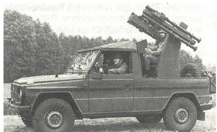
Aus Soldat und Technik 5/1993

soll die Krisenreaktionskräfte vor Angriffen aus der Luft schützen. Der Waffenträger, auf dem ein Abschussgestell für vier STINGER montiert sein wird, soll in einer CH-53 luftverladbar sein. Ob dafür besser ein Radfahrzeug oder ein Kettenfahrzeug geeignet erscheint, wird bis zur Billigung einer Taktisch-technischen Forderung (TTF) abschliessend bewertet. Je fünf Waffenträger bilden mit einer Aufklärungs- und Feuerleiteinheit einen autonomen Zug. Drei Züge werden in einer Batterie mit Verbindungstrupps