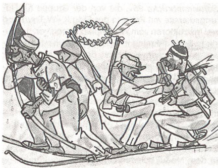
Die Tösstaler Siegerpatrouille an den Weissen SUT 1958 in Entlebuch.

Der UOV Tösstal kann dieses Jahr sein 50jähriges Bestehen feiern. Aus der umfangreichen, informativen und gutbebilderten Jubiläumsschrift stammen die beiden folgenden Karikaturen von Hans Frey.