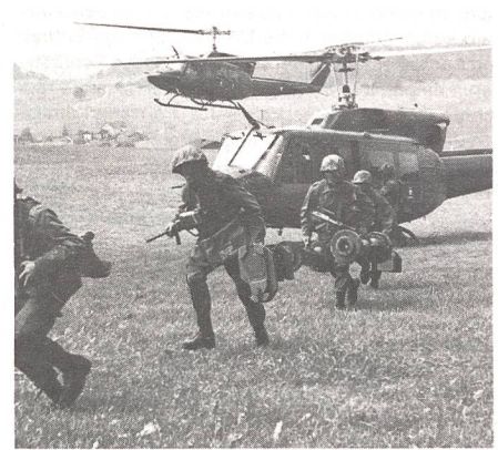
Mittels Hubschrauber gelandete Jägergruppe mit Panzerabwehrwaffen Bill.

Ein Konflikt zwischen den Staaten «Orange» und «Grün» lag der Übungsannahme zugrunde. Er eskalierte und griff zum Teil am Boden und in der Luft auf den Nachbarstaat «Blau» über. Dessen Verteidiger, dargestellt von den Militärakademie-Schülern samt den von ihnen geführten Truppen, hatten das zu verhindern. Bewaffnete Verbände von «Grün» und «Orange» versuchten auf das Staatsgebiet von «Blau» vorzudringen. Sie versuchten das fremde Territorium zu benützen, um dem Feind in die Flanke zu stossen und teilweise auch, um «Blau» zu provozieren. Gleichzeitig trat eine grosse Anzahl ziviler