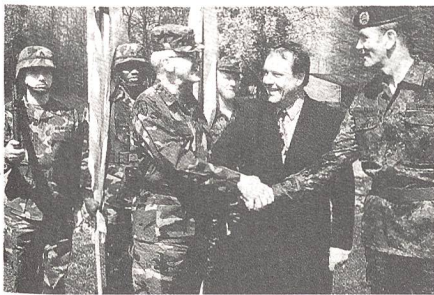
Gemeinsamkeit besiegeln der US-General David M Maddox, Minister Volker Rühle und Generalleutnant Helge Hansen.

nale Streitkräftestrukturen sind Ausdruck für die revolutionären sicherheitspolitischen Veränderungen».