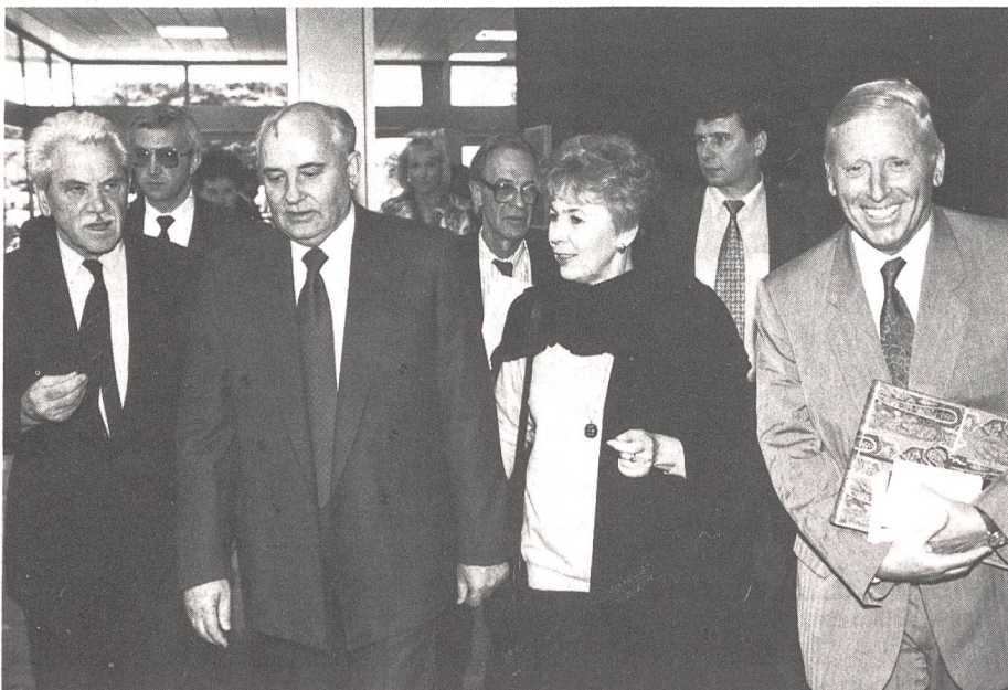
Empfang von Michail und Raissa Gorbatschow am Hauptsitz der «Winterthur»-Versicherungen.

.... Die Welt der Politik und insgesamt breite Kreise der Weltöffentlichkeit stecken heute in einer gewissen Ratlosigkeit angesichts der neuen Herausforderungen, die sich mit der Beendigung des kalten Krieges und der globalen Konfronta-