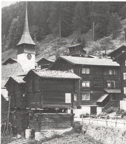
Dorfkern von Niederwald im Oberwallis.

Unter anderem wurde ein Wanderweg wieder instandgestellt, der fast völlig verlottert war. An einer anderen Stelle bedrohte ein Felsvorsprung, der im Herbst vergangenen Jahres abzubröckeln begonnen hatte, einen Weg. Rund 40 Kubikmeter Fels mussten hier abgetragen werden, ohne dass man im unwegsamen Gelände Baumaschinen hätte einsetzen