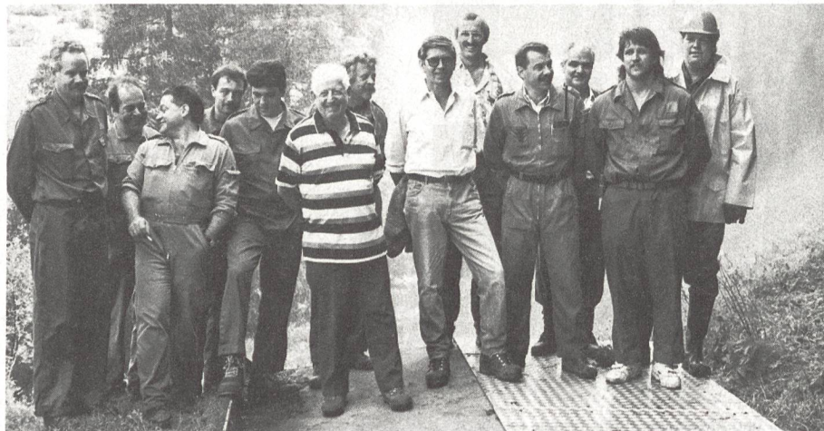
Zivilschützer vom Aargau vor der Bewässerungs-Sprinkleranlage.

Was die Arbeit des Zivilschutzes angeht, versucht man in Wohlen immer wieder, Einsätze zugunsten der Gemeinden zu realisieren. Erste Erfahrungen wurden hier bereits 1989 gesammelt. Die ZSO Wohlen half damals mit, die Verwüstungen zu beseitigen, die der Sturm «Viviane» im Wald hinterlassen hatte. Schon damals zog man in Wohlen die Lehre aus dieser Übung, dass Zivilschutz durchaus flexibel gehandhabt werden kann.