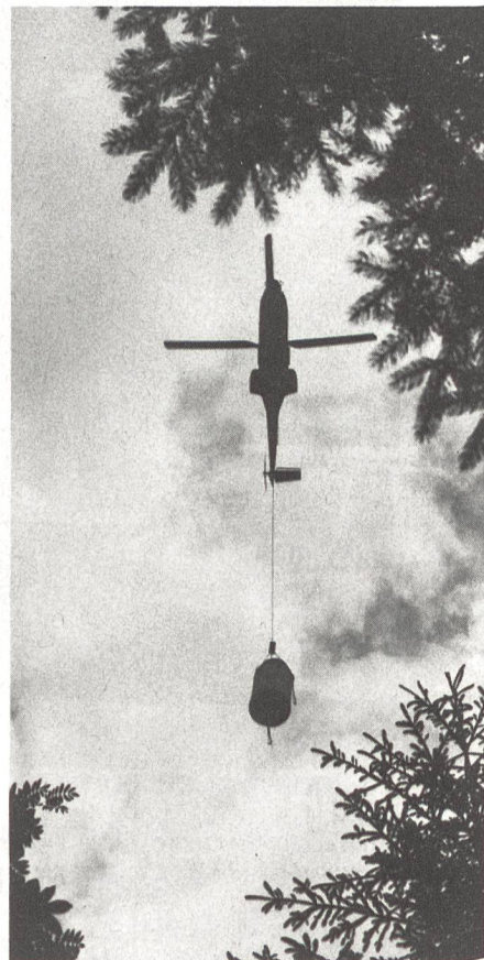
Transportheli der Armee «SUPER PUMA» mit grossem Betonschacht für das Reservoir.