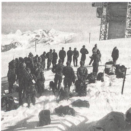
Orientierung auf dem Titlis vor dem 100-Kilometermarsch, mit dem Ziel Signau im Emmental.

wald oberhalb des Dorfes Buochs bezogen sie, von Wangen herkommend, Biwak. Zum Beginn räumten sie drei Bunkerruinen aus dem Zweiten Weltkrieg, in unmittelbarer Nähe des Sees, weg. Mit Pressluft-hämmern und Mithilfe durch einen Zug Luftschutz-Rekruten rückten die Offiziers-Aspiranten den Betonbunkern zu Leibe. Um die Beweglichkeit der Truppe zu testen, hatten sie auch Spontaneinsätze zu leisten.