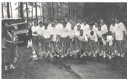
Vreni Schneider (links) gab in Buochs den Startschuss zum Berglauf aufs Buochserhorn.

Die 27 Offiziers-Aspiranten der Luftschutztruppen werden ihre Durchhaltewoche vom 22. bis 29. September 1993 nicht so schnell vergessen. Einerseits, weil sie mit harten Bunkerabbruch-Arbeiten in Buochs einen äusserst nahrhaften Beginn verzeichneten, andererseits auf dem 100-Kilometermarsch zwischen 2000 und 3000 Meter Höhe, in Schnee und Kälte einen weitem Härtestest zu beweisen hatten. Für einen unvergesslichen Moment sorgte Weltcupfahrerin Vreni Schneider, die in Buochs den Startschuss zum Berglauf aufs Buochserhorn erteilte. Die Durchhaltewoche der 27 Offiziers-Aspiranten der Luftschutztruppen führte die Beteiligten in die Innerschweiz unter dem Kennwort «Titlis». Im Buochser-